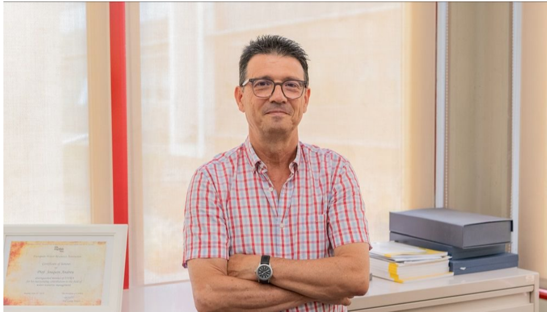
🔗 Joaquín Andreu, investigador y catedrático de la UPV, Premio Nacional de Ingeniería Civil 2023